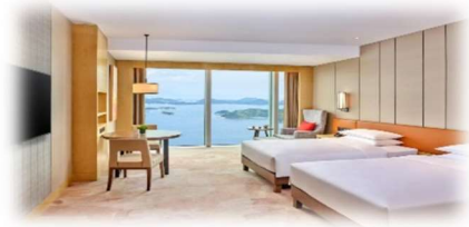
<深圳鹽田凱悅酒店>