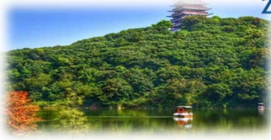
<大王山森林風景區>