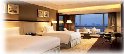
<佛山希爾頓花園酒店>