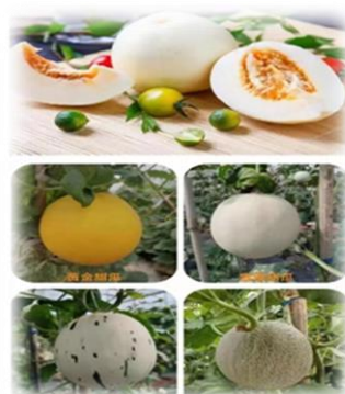
< 山城水都陽光湖農旅公園 >