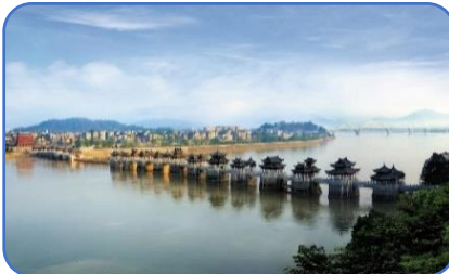
中國四大名橋之一【湘子橋】